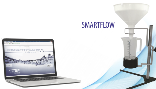
Ноутбук для мобильного использования