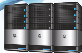
Подключение к ПО кабинета частной практики (GDT) или ПО больницы (H17)