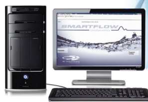
Настольный ПК в больнице или частной практике